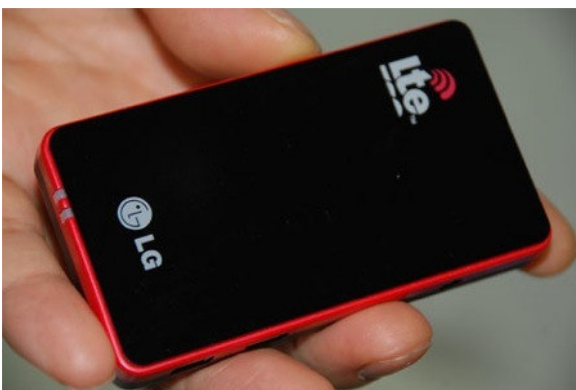
Een voor LTE geschikte handset van LG, gepresenteerd op de CommunicAsia expo in Singapore.

Long Term Evolution (LTE) is een door 3GPP ontwikkelde standaard voor 4G radio technologie. Met LTE kan de eindgebruiker in theorie down- en uploadsnelheden behalen van enkele tientallen Mbps. De in werkelijkheid ervaren snelheden zijn onder andere afhankelijk van het spectrum dat de operator tot zijn beschikking heeft, het aantal eindgebruikers per antenne en de afstand tussen de eindgebruiker en de antenne. Er zijn nog maar enkele handsets beschikbaar die deze technologie ondersteunen, maar onder andere Siemens, Motorola, Nokia, Ericsson en LG Electronics hebben aangegeven LTE als de nieuwe standaard te zien voor mobiele telefonie en de komende jaren met nieuwe handsets te komen die LTE-compatibel zijn.